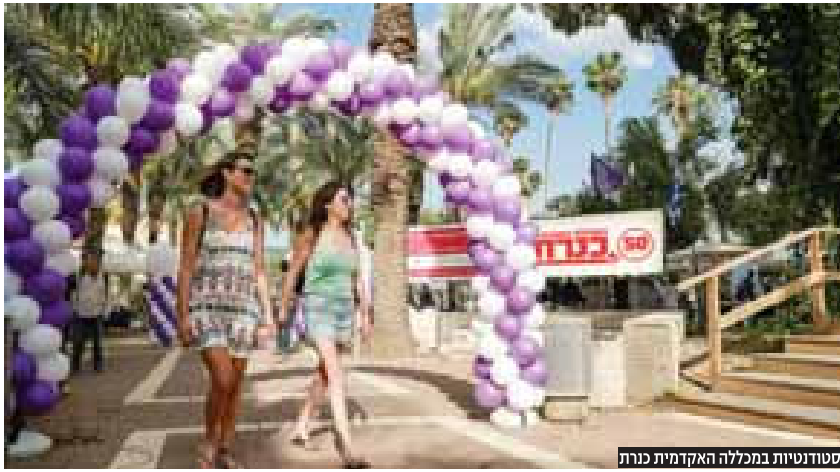
סטודנטיות במכללת האקדמית כנרת

מדרות היא החלק שלקחתי איתי לישראל, לקיבוץ וגם להשכלה הגבוהה. בחינוך הקיבוצי החשיבה הביקורתית הייתה חלק אינטגרלי לי של האידאולוגיה החינוכית. את זה הרגשתי בחינוך ילדינו במערכת החינוך הקיבוצית ואחר כך כמורה ומחנכת. מאד התחברתי לזה. לקחתי את זה איתי גם להשכלה הגבוהה והחברים שלי יעידו על כך."